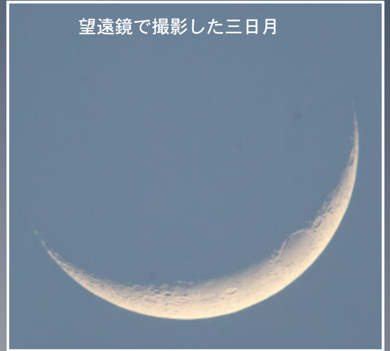
望遠鏡で撮影した三日月